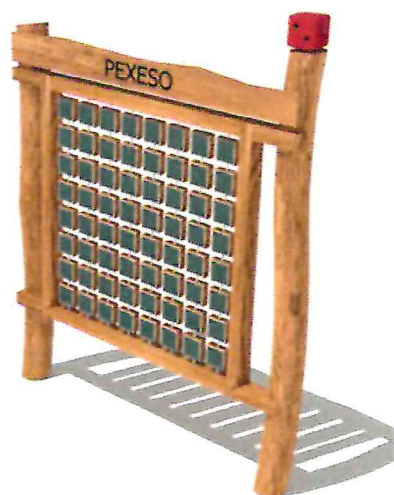
Příloha č.1 Ukázka některých edukačních prvků na dětské hřiště